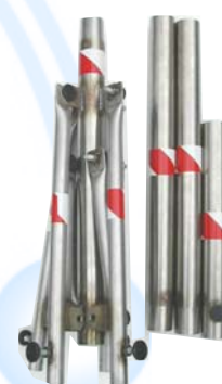
Les éléments du mât