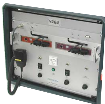
Façade avant ouverte