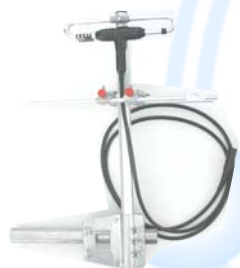
L'antenne 450 MHz