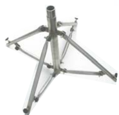
Le trépied déplié