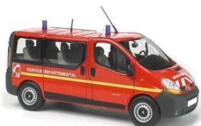
Réseau de surface 85 MHz